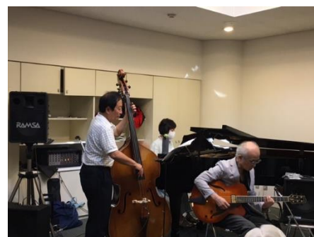
ミニコンサートの模様

を実践すると音楽の楽しみ方が変わり幸福感がより増すというものです。今回もジャズを中心にその楽しみ方のお話をしていきました。